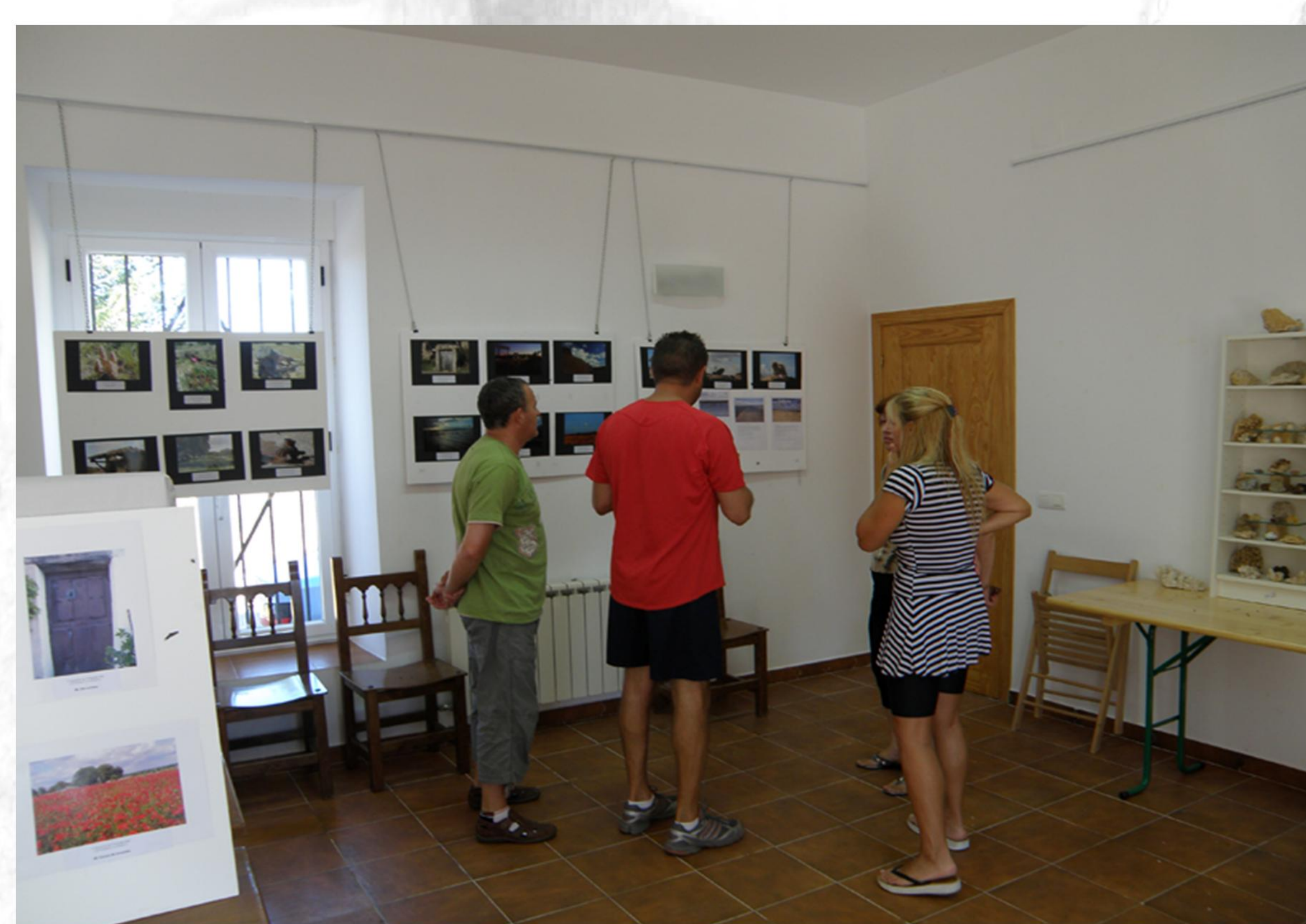
Actividades de difusión

Su conocimiento, ordenación, preservación y protección es nuestro fin prioritario y para ellos se debe trabajar desde la propia administración local junto con los expertos en materia etnográfica, arquitectónica y arqueológica.