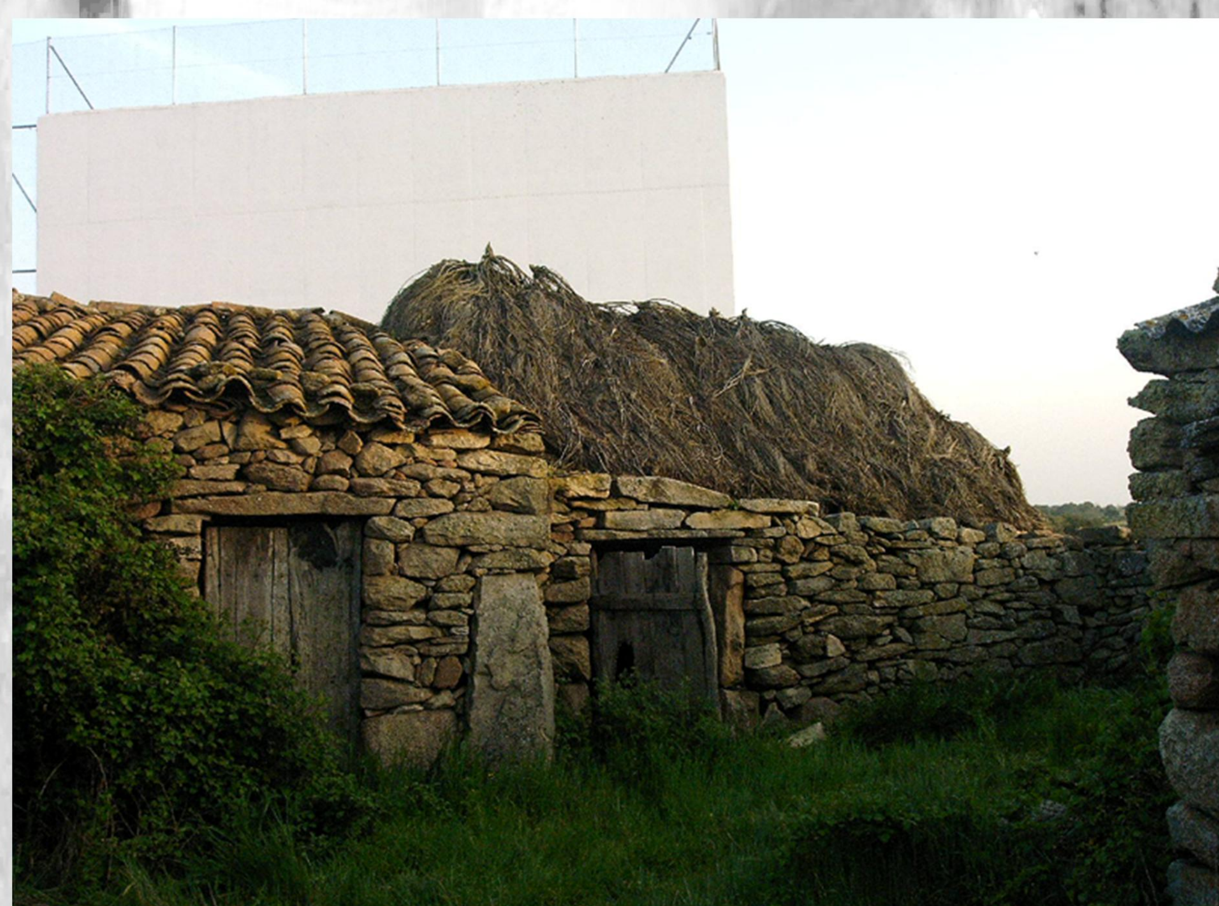
Construcción típica de piedra seca y techado vegetal de La Ramajería